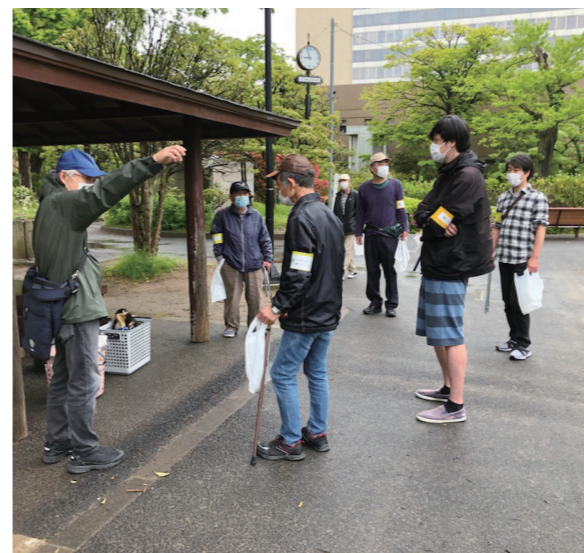
就労意欲を失わないために市内や公園の清掃活動を実施

私たちの活動は伴走型支援です。本人たちの依存症への自覚がなければ、私たちの支援活動の力も効果も弱まります。人は何かしらの依存を抱えています。苦しんでいるのは自分だけではなく他の人も同様だと認識し、皆で力を合わせて克服への道を歩くことが必要と考えます。