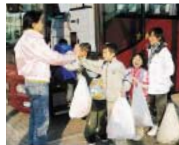
「来年も来るよっ!」と約束のハイタッチ。