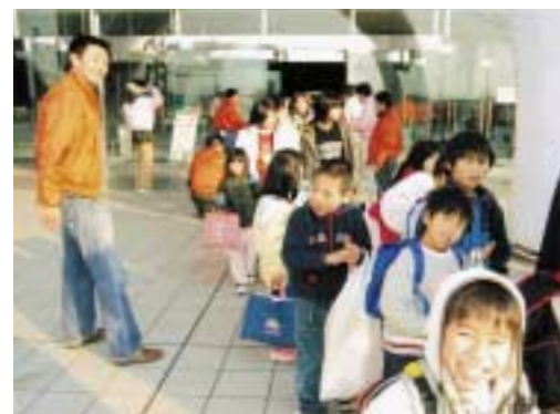
子どもたちの笑顔につられて、スタッフの顔もほころぶ。