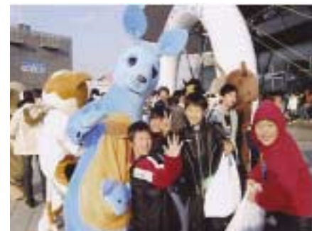
着ぐるみ隊の見送り で子どもたちは最後まで大満足。

去年は20人近くが参加したんですが、施設までバスが送迎してくれますから引率が2人で十分なのもありがたい。会場でもたくさんのお店、食べ物、救急とスタッフの方々が気を配ってくれますから、私も子どもと一緒に遊んでいます」