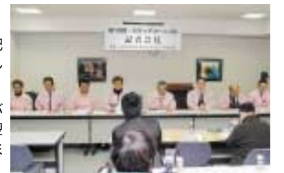
(下)未来っ子カーニバルの記者会見。開催翌日には毎年地元マスコミで大きく報道されている。