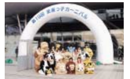
(上)半年以上の準備が報われて、充実の表情。 (中)着ぐるみを脱いで記念撮影。お疲れさまでした。