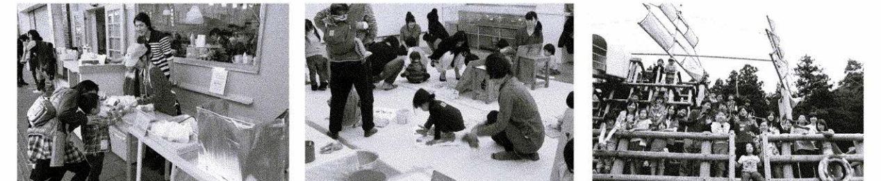
「こどもっちゃ!」商店街事業 - こどもっちゃ! 商店街実行委員会 -